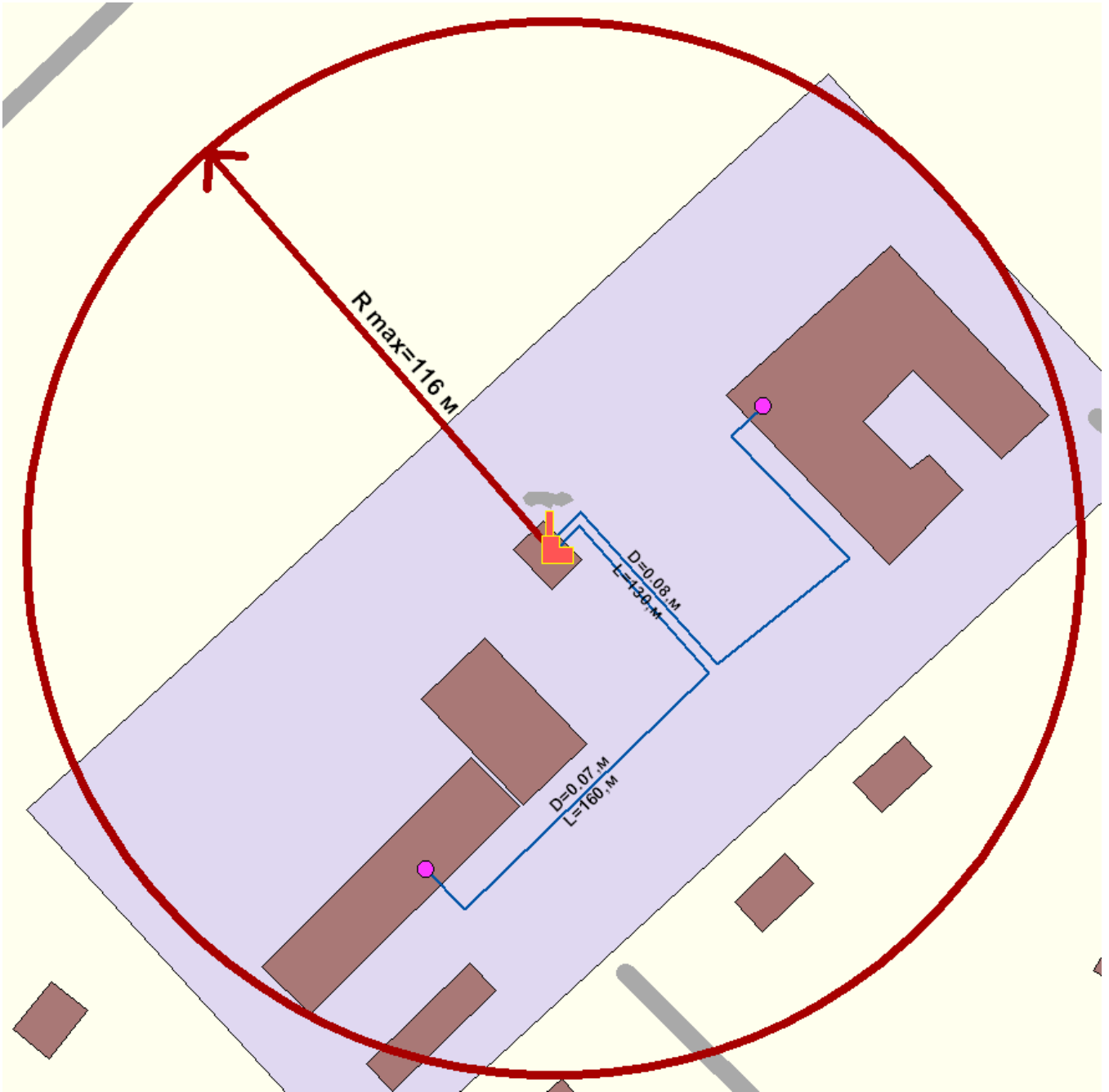
Рис.2 Радиус эффективного действия котла наружного размещения с. Усох